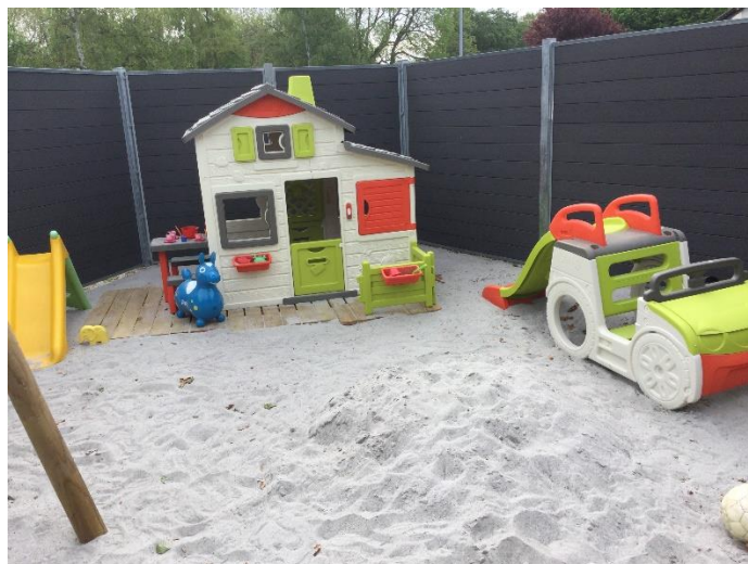
Legehus ved sandkasse